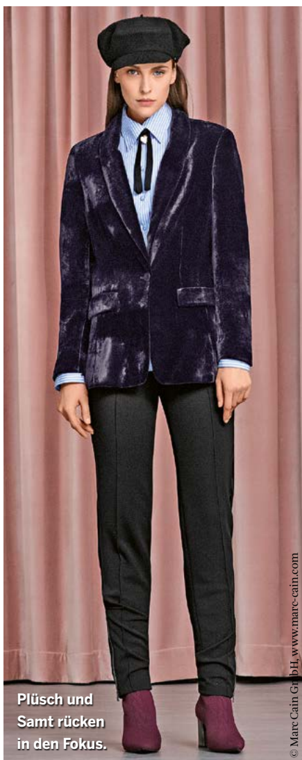
Plüsch und Samt rücken in den Fokus.

Alles ist möglich! Frau hat Mut zur Farbe und Prints in der kommenden Saison! Bei vielen Marken stehen für die Herbst-Winter-Kollektionen starke Akzente, Prints und Farbigkeit im Vordergrund.